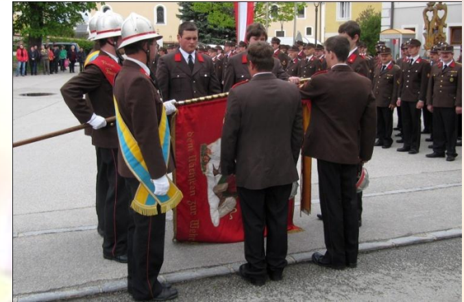
Florianifeier / Angelobung