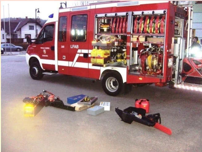
Fahrzeugschulung neues LFAB