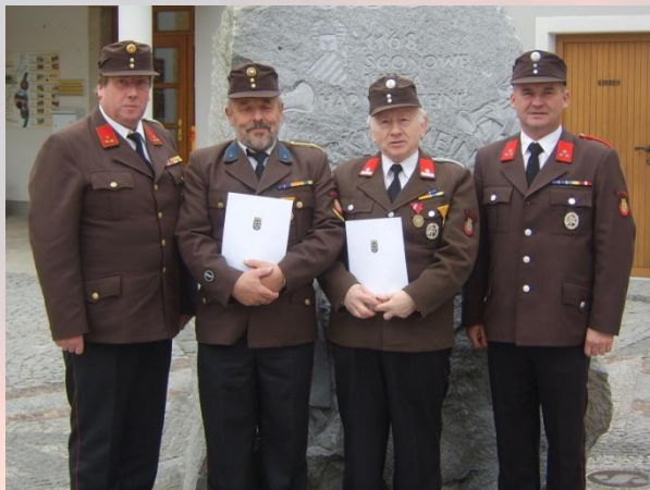
Ehrungen beim Abschnittsfeuerwehrtag