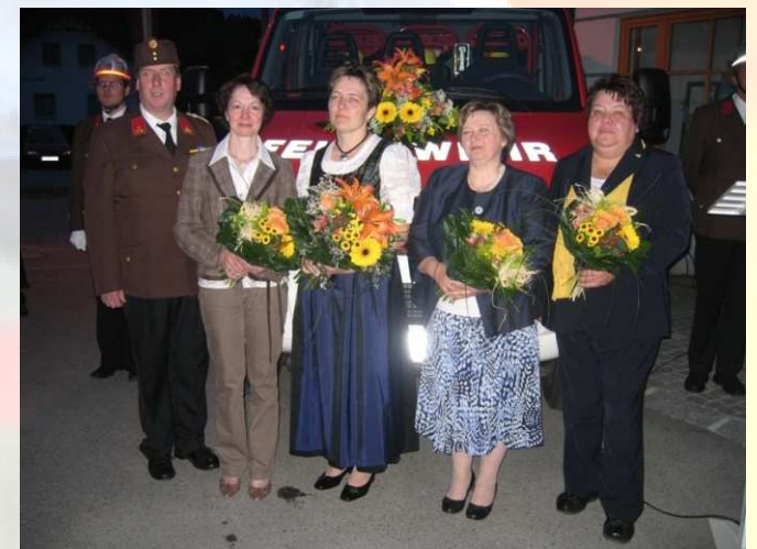
Fahrzeugsegnung neues Löschfahrzeug LFAB