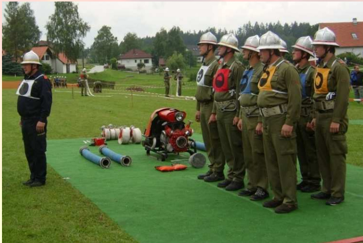
Bezirksfeuerwehrleistungsbewerb in Schlag