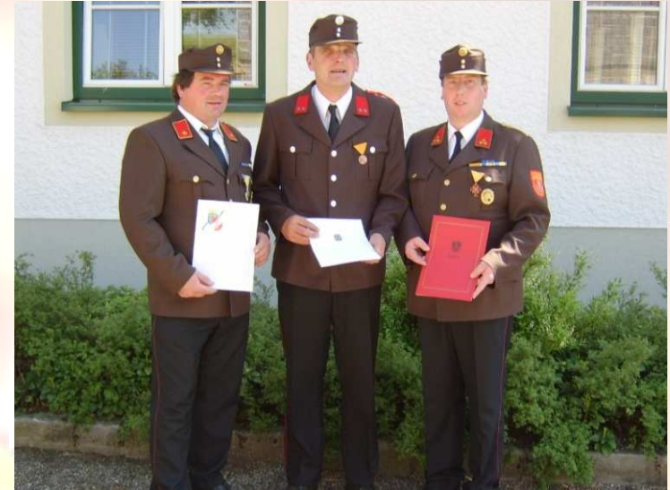
Ehrungen am Abschnittsfeuerwehrtag