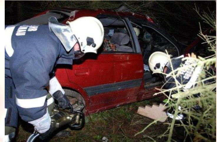
Unterabschnittsübung in Engelstein